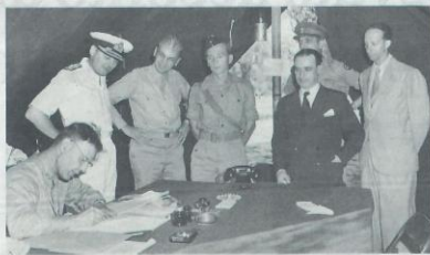
EVENTO A fianco la firma dell'Armistizio e sotto la gioia quando la notizia venne resa pubblica

La fuga dalla Capitale dei vertici militari, di Badoglio, di Vittorio Emanuele III e di suo figlio Umberto dapprima verso Pescara e poi verso Brindisi e non reale senso di comprensione delle clausole armistiziali (i più le interpretarono er-