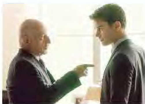
Una scena di «Giocchi di potere»