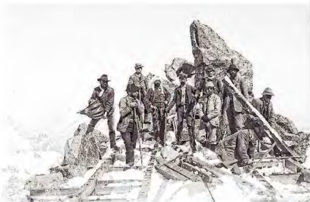
La costruzione della capanna Margherita sulla Punta Gniffetti, sopra il Colle del Lys, nel 1892