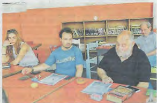
GLI ORGANIZZATORI SPIEGANO I DETTAGLI DELLA FESTA