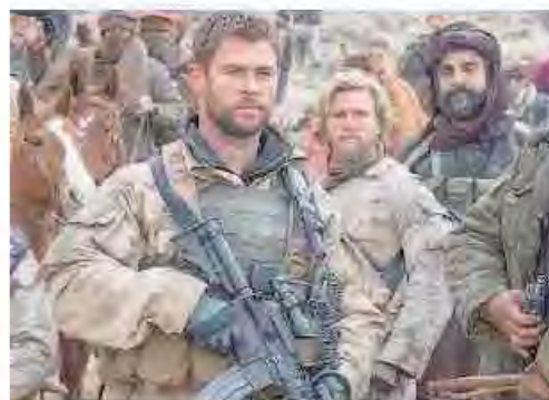
Un ciak di «12 soldiers»