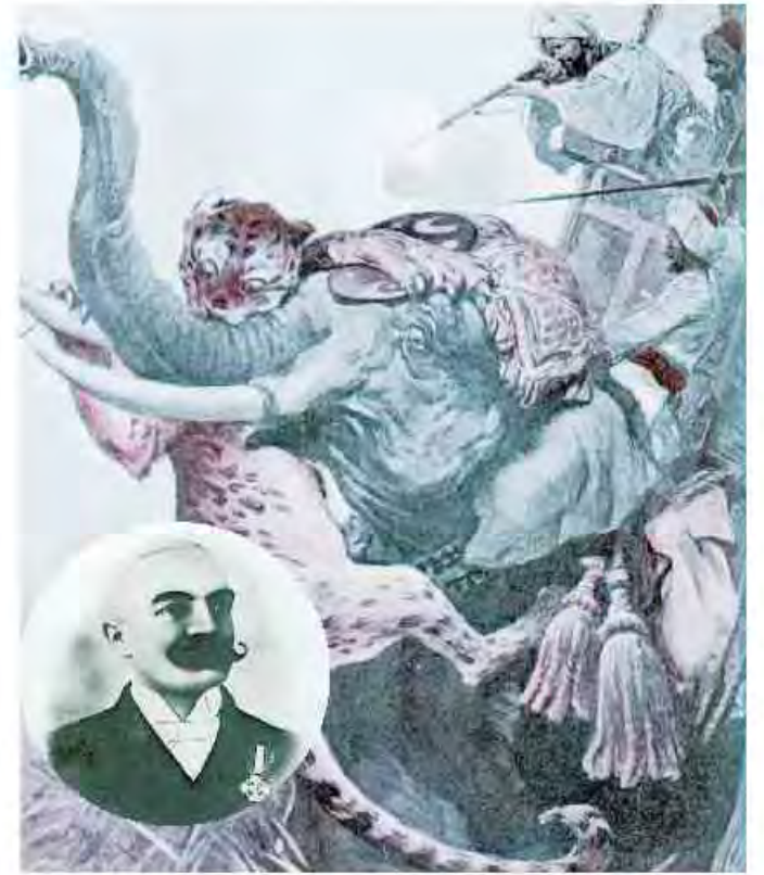
Un'illustrazione de La montagna di luce . Emilio Salgari nel 1897

Emilio Salgari arrivò a Genova nel 1898 e nella casa di Sampierdarena nacque il suo terzogenito, Romero. «A Genova - racconta Felice Pozzo - incontrò l'editore tedesco Donath, che stava diventando famoso. E che fu il solo a capire che Salgari andava vincolato con un contratto in esclusiva, assecondando i suoi desideri». Con il lungimirante Donath, a cui resta legato fino al 1906, Salgari scrive i suoi capolavori: I pira-