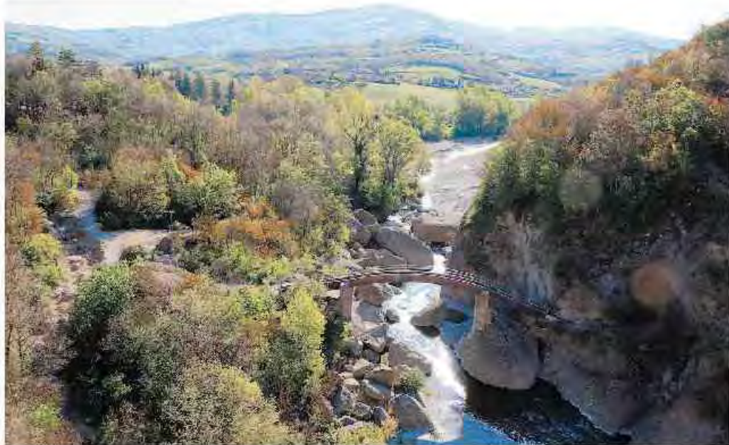
Le Strette di Pertuso in Val Borbera sede di battaglie partigiane rievocate nel festival