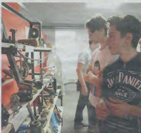
Gli studenti dell'Artom che hanno realizzato il Museo