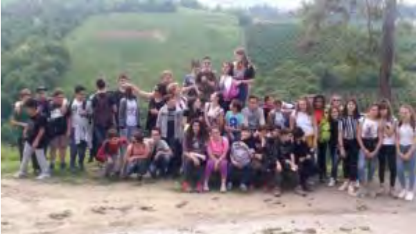
I ragazzi della scuola media nicese ritratti sui

dalla casa editrice "Il Mulino"), i "viaggi della memoria", ricerche, corsi di aggiornamento per insegnanti, una radicata e sempre più estesa attività didattica che, soltanto nell'ultimo anno scolastico, ha portato a coinvolgere circa 3.500 studenti, spaziando dalle primarie agli istituti superiori.