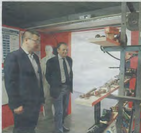
In visita a «Industriamoci» ad ammirare i reperti

Grazie a un percorso multimediale sembra di entrare nelle fabbriche di un ricco passato ma ci sono anche reperti autentici come ad esempio i «bulun» della Way Assauto