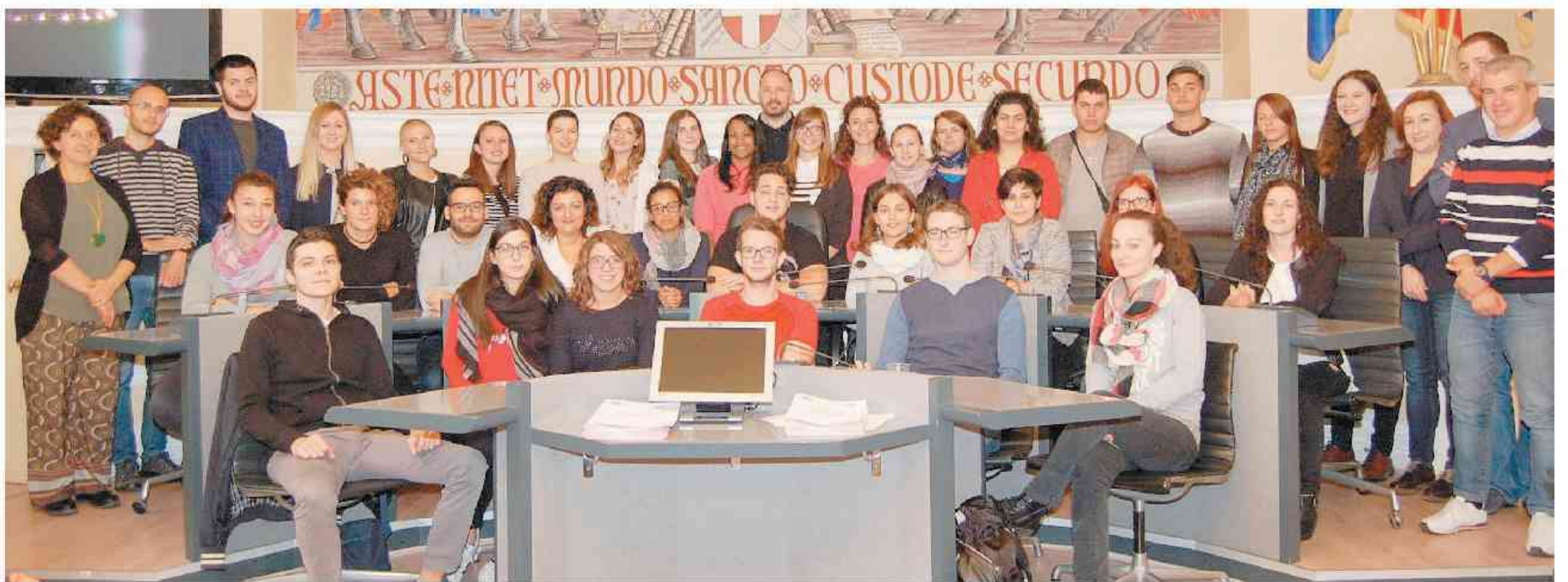
I giovani che hanno partecipato alla presentazione in municipio dei bandi per il Servizio civile coordinati dal Comune di Asti