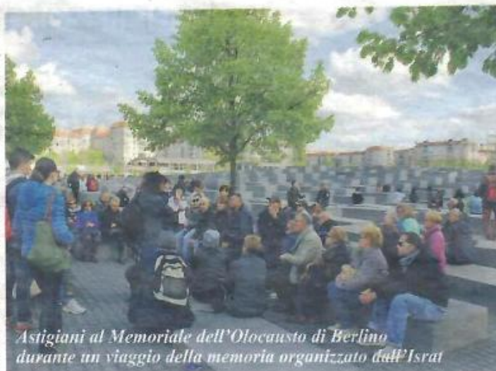
Astigiani al Memoriale dell'Olocausto di Berlino durante un viaggio della memoria organizzato dall'Israt

Anche nel programma di quest'anno l'offerta formativa Israt per le scuole di ogni ordine e grado offre più occasioni tematiche di approfondimento: l'antisemitismo nella storia; il sistema concentrazionario nazista; il "razzismo scientifico": dall'eugenetica al progetto di stato razziale nazista; il negazionismo. Le classi possono prenotarsi allo 0141-354835 o inviando una mail a info@israt.it . Sul sito web www.israt.it si può consultare il programma completo degli eventi e delle iniziative a cui l'Israt parteciperà con