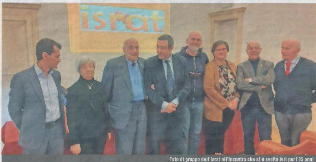
Foto di gruppo dell'Israt all'incontro che si è svolto ieri per i 35 anni

Facendo così risparmiare all'ente 12 mila euro. La fondazione Cassa di risparmio di Asti ha stanziato un contributo di 5 mila euro ed esaminerà un progetto di fi-