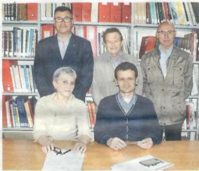
Il direttivo dell'Istituto per la storia della Resistenza di Asti