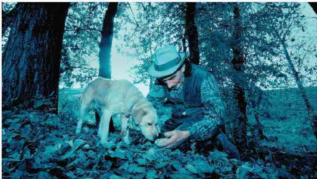
Un trifolau con il cane da ricerca

Sono stati 1120 i tartuficoltori che hanno presentato la