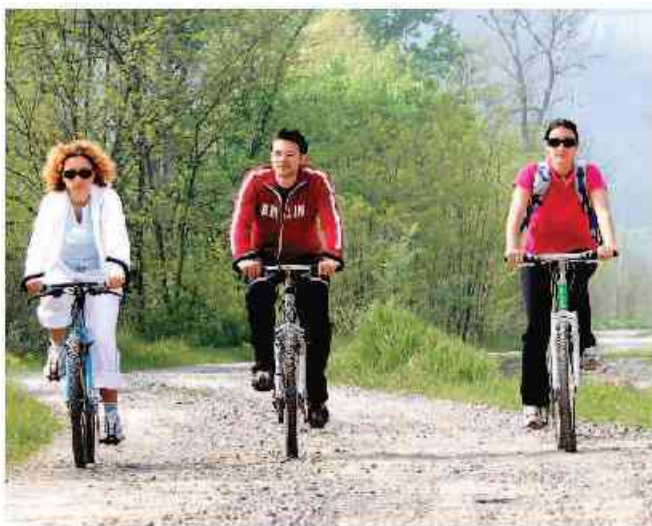
In bicicletta lungo le sponde del Tanaro