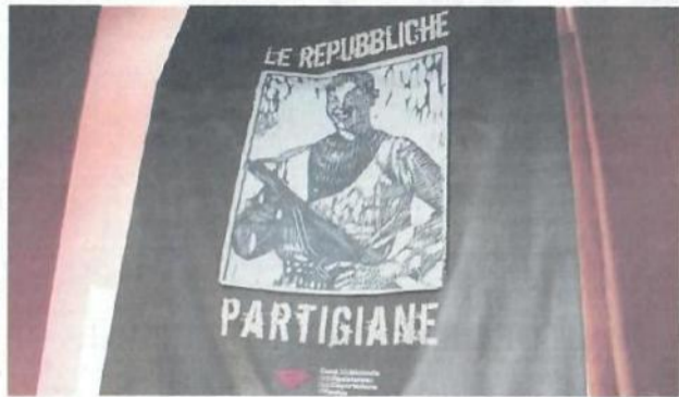
UNO SCORCIO DELLA CASA DELLA MEMORIA DI VINCHIO

A Vinchio, sede della Casa della Memoria, si prepara invece la "passeggiata sulle colline partigiane" fissata per il 25 agosto. La camminata è proposta da Israt, Casa della Memoria, Associazione culturale Davide Lajolo e Comune con il patrocinio del Consiglio regionale del Piemonte e del Comitato Resistenza e Costituzione.