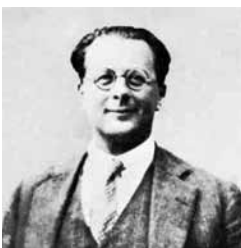
Carlo Rosselli Carlo e Nello Rosselli